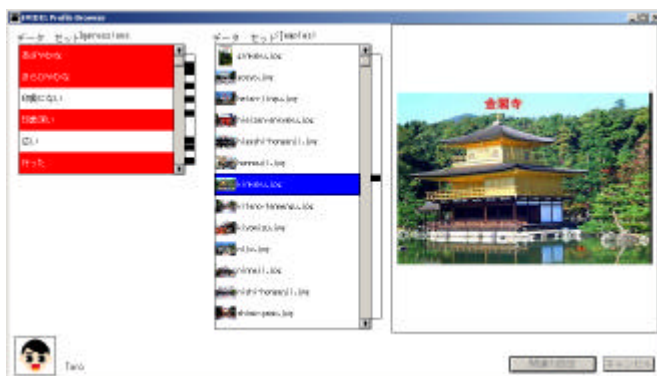
図1: 各個人が言葉に対して画像を選択する Profile Browser

関連付けを可視化した結果は Map Viewer を使用して見ることができる(図2). Map Viewer 上では主に以下の操作が可能である.